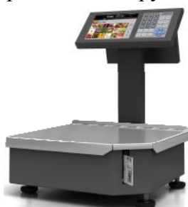
Рисунок 1 – Весы Штрих РС-200 С7В - М7В

Варианты конструктивных исполнений весов: