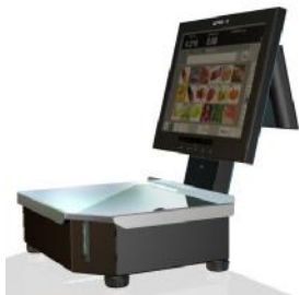
Рисунок 5 – Весы Штрих РС-200 С15В - 7В