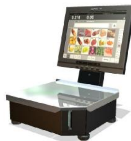
Рисунок 6 – Весы Штрих РС-200 С15В

В весах предусмотрены следующие устройства и функции: