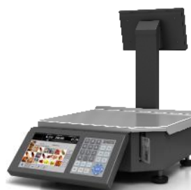
Рисунок 2 – Весы Штрих РС-200 С7Н - М7В