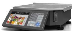
Рисунок 3 – Весы Штрих РС-200 С7Н - М7Н