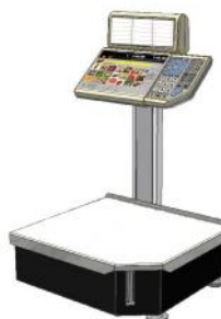
Рисунок 4 – Весы Штрих РС-200 С7В - ДВ